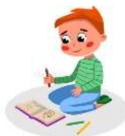
criança fazendo momento com Deus