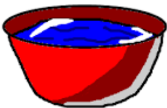
Em uma bacia

Atividade: Circule onde Eliseu mandou Naamã tomar banho: