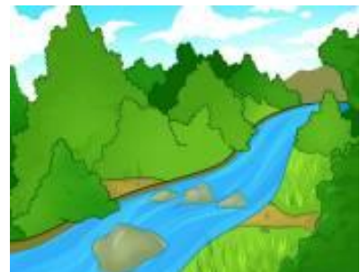
No rio Jordão

ORAÇÃO – LEIA E A CRIANÇA REPETE: Senhor Deus, eu quero fazer o que tu mandas. Em nome de Jesus. amém.