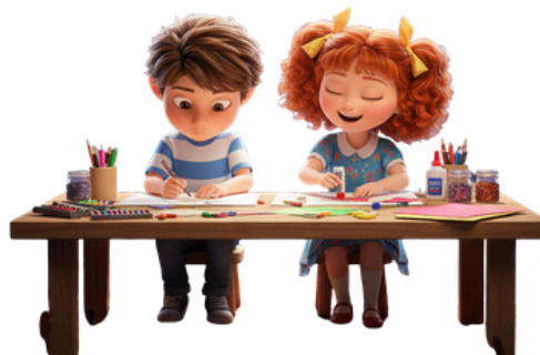
FAZENDO A ATIVIDADE EM FAMÍLIA