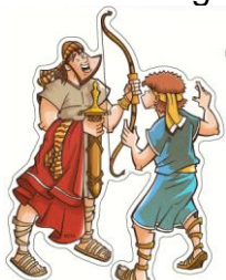
Tocar um instrumento