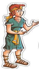
Falar em público