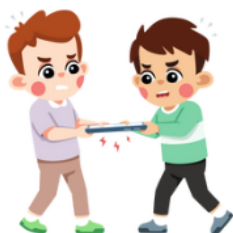
BRIGUEI COM UM AMIGO.

CONTO PARA MEUS PAIS E EXPLICO O QUE ACONTECEU.