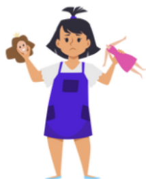
QUEBREI UM BRINQUEDO.

QUANDO FAZEMOS ALGO ERRADO, DEVEMOS ASSUMIR E ASSIM AS CONSEQUENCIAS NÃO SERÃO TÃO DIFÍCEIS. LIGUE A AÇÃO ERRADA A ATITUDE CERTA.